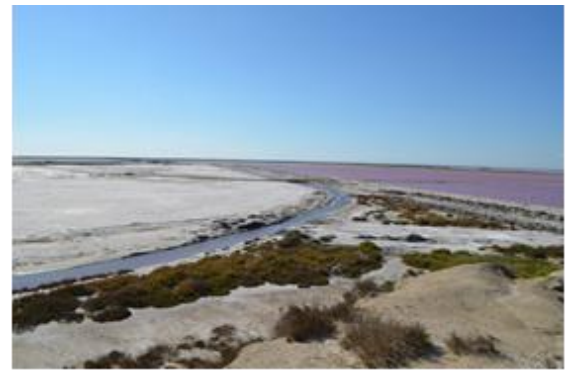
Regionalni park Camargue

U slučaju da se posjetitelja zatekne u predmetnom području tijekom trenutka zabrane boravka, kazna iznosi 136 eura.