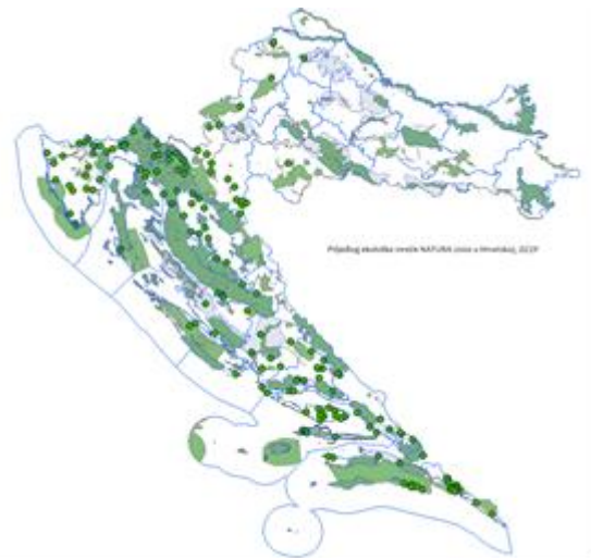
Prijedlog ekološke mreže NATURA 2000 u Hrvatskoj (cca 36%)

Nakon studijskog putovanja na jug Francuske i posjeta nekoliko zaštićenih dijelova prirode u različitim kategorijama zaštite kao i područja ekološke mreže Europske unije Natura 2000, Ramsar područja, te rezervata biosfere, otvara se usporedba sa zaštićenim dijelovima prirode u Hrvatskoj. Sve ove kategorije zaštite postoje u Hrvatskoj, te se primjenjuje sličan pristup upravljanja područjima.