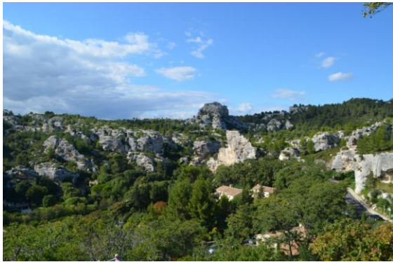
Regionalni Park prirode Allpiles

Usporedbom aktivnosti provedbe preventivnih mjera zaštite šuma od požara u zaštićenim dijelovima prirode postoje velike sličnosti. Ipak, tijekom posjeta područja Sainte-Victoire posebno je opisana djelatnost zaštite od požara šuma, te je istaknuto da je sadašnji koncept zaštite rezultat višegodišnjeg rada i suradnje ustanove zaštićenog područja s lokalnom i regionalnom zajednicom, a temelji se na stručnim i znanstvenim podacima iz područja agrometeorologije.