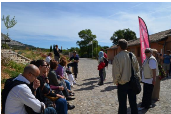
Park prirode Grand Site Sainte-Victoire – predavanje o sustavu zaštite od požara

Posebnost sustava zaštite od požara je reguliranje posjeta zaštićenog područja, a sve u svrhu što sigurnijeg boravka posjetitelja.