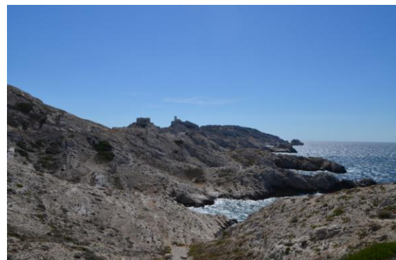
Nacionalni park Calanques

Obzirom na slične klimatske uvjete i biljni sastav šumskih fitocenoza, cilj nam je razviti i primijeniti odgovarajući sustav zaštite od požara kako bismo unaprijedili dosadašnje aktivnosti i zakonske obveze zaštite od požara u zaštićenim dijelovima prirode Dubrovačko-neretvanske županije.