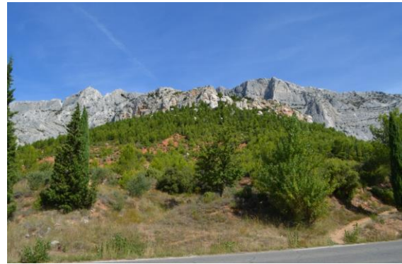
Park prirode Grand Site Sainte-Victoire

Posebnost sustava zaštite od požara je reguliranje posjeta zaštićenog područja, a sve u svrhu što sigurnijeg boravka posjetitelja.