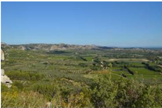
Regionalni Park prirode Allpiles

Usporedbom aktivnosti provedbe preventivnih mjera zaštite šuma od požara u zaštićenim dijelovima prirode postoje velike sličnosti. Ipak, tijekom posjeta područja Sainte-Victoire posebno je opisana djelatnost zaštite od požara šuma, te je istaknuto da je sadašnji koncept zaštite rezultat višegodišnjeg rada i suradnje ustanove zaštićenog područja s lokalnom i regionalnom zajednicom, a temelji se na stručnim i znanstvenim podacima iz područja agrometeorologije.