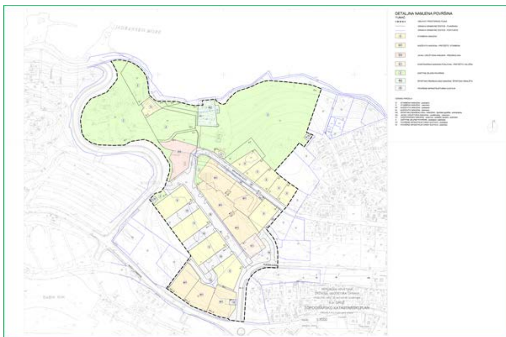
Kartografski prikaz 1. Detaljna namjena površina

te Grafički dio Plana - svi kartografski prikazi: