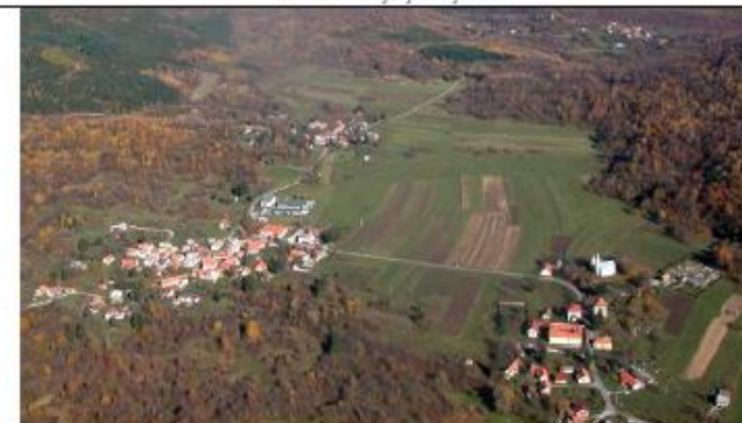
Prepoznatljivi uzorci naselja i neizgrađenog krajolika