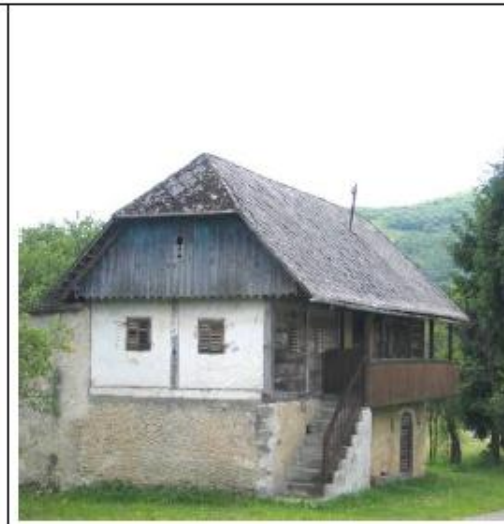
Prepoznatljiva tradicijska gradnja