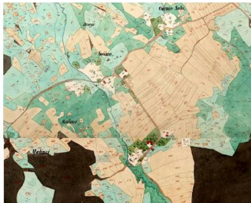
Sošice na izrezu iz karte katastarske izmjere 1863. godine