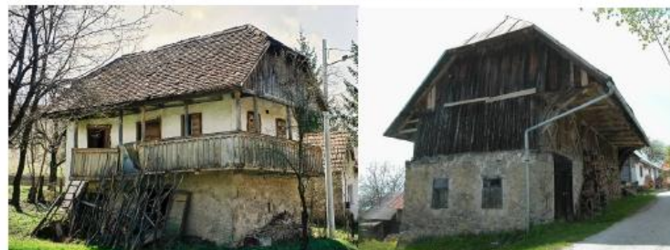
Uobičajena i prepoznatljiva stambena i gospodarska tradicijska izgradnja