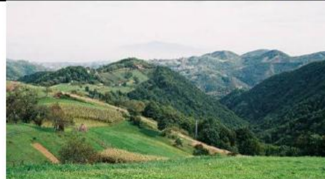
Vizualna obilježja krajolika