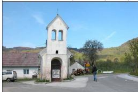
Raskrižje s kapelicom