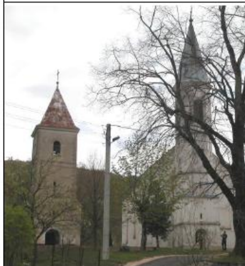
Crkva sv. Petra i Pavla i kapela Blažene Djevice Marije