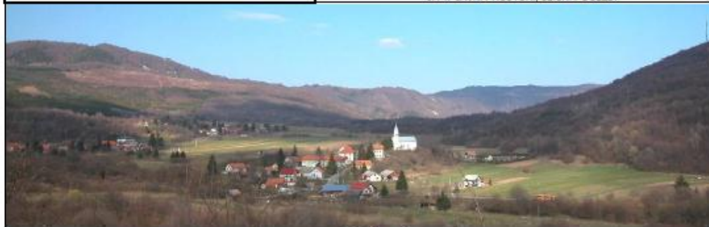
Panorama naselja Sošice s jugozapada