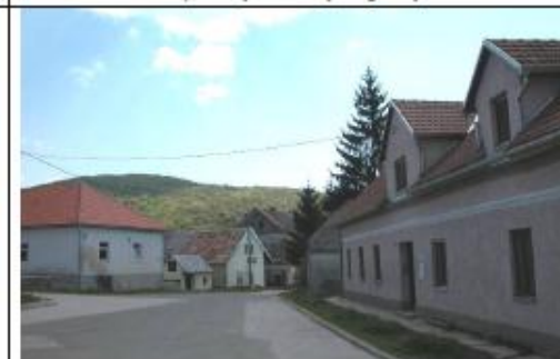
Pogled na glavnu ulicu