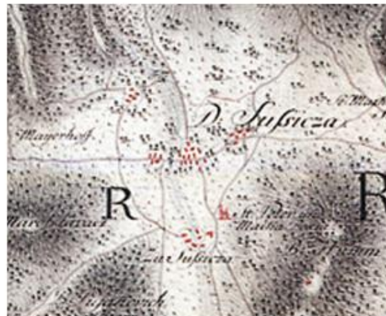
Sošice na izrezu iz Jozefinske karte 1763-85. godine

Povijesni razvoj - naselje na povijesnim kartama 18. i 19. st