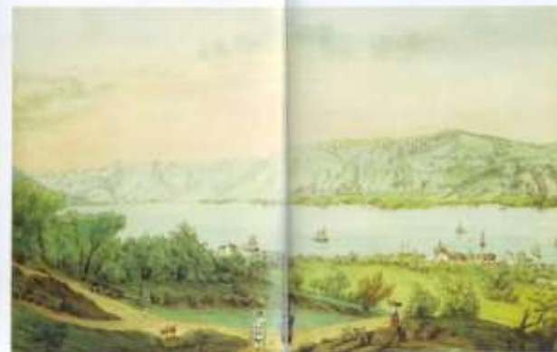
Bocche di Cattaro - Vista della Grotta di Kretac