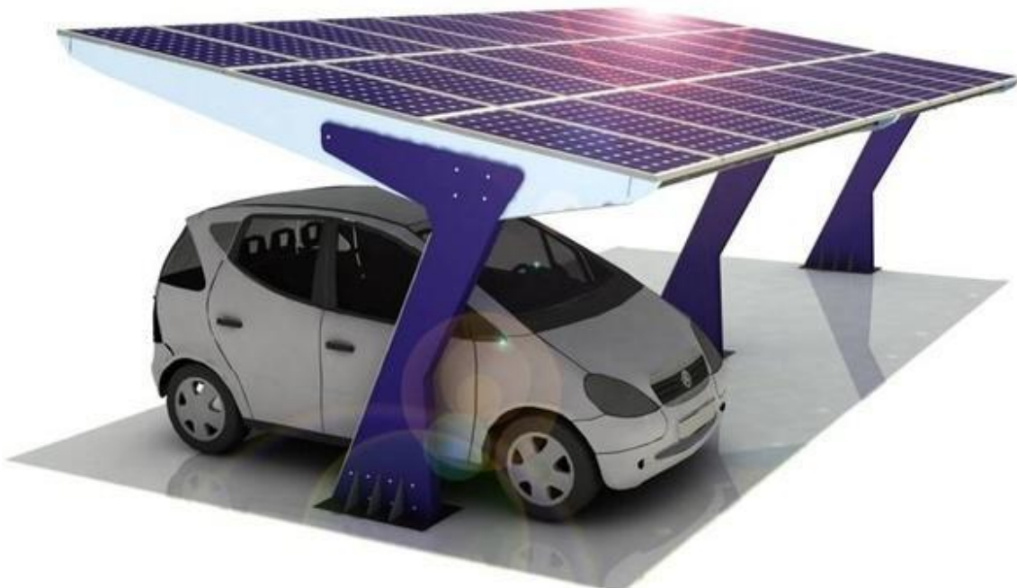
Prikaz 4: Primjer potkonstrukcije-prihvata modula

Fotonaponski modul ima životni vijek od preko trideset godina i jedan je od najpouzdanijih poluvodičkih proizvoda. Fotonaponskim sustavima je potrebno minimalno održavanje. Na kraju životnog vijeka moduli se mogu gotovo u potpunosti reciklirati, a sastavne sirovine mogu se ponovno koristiti. Zbog povoljnog geografskog položaja potencijali za proizvodnju električne energije su visoki. Tipična očekivana proizvodnja po kilovatu instalirane snage iznosi oko 1300 kWh godišnje.