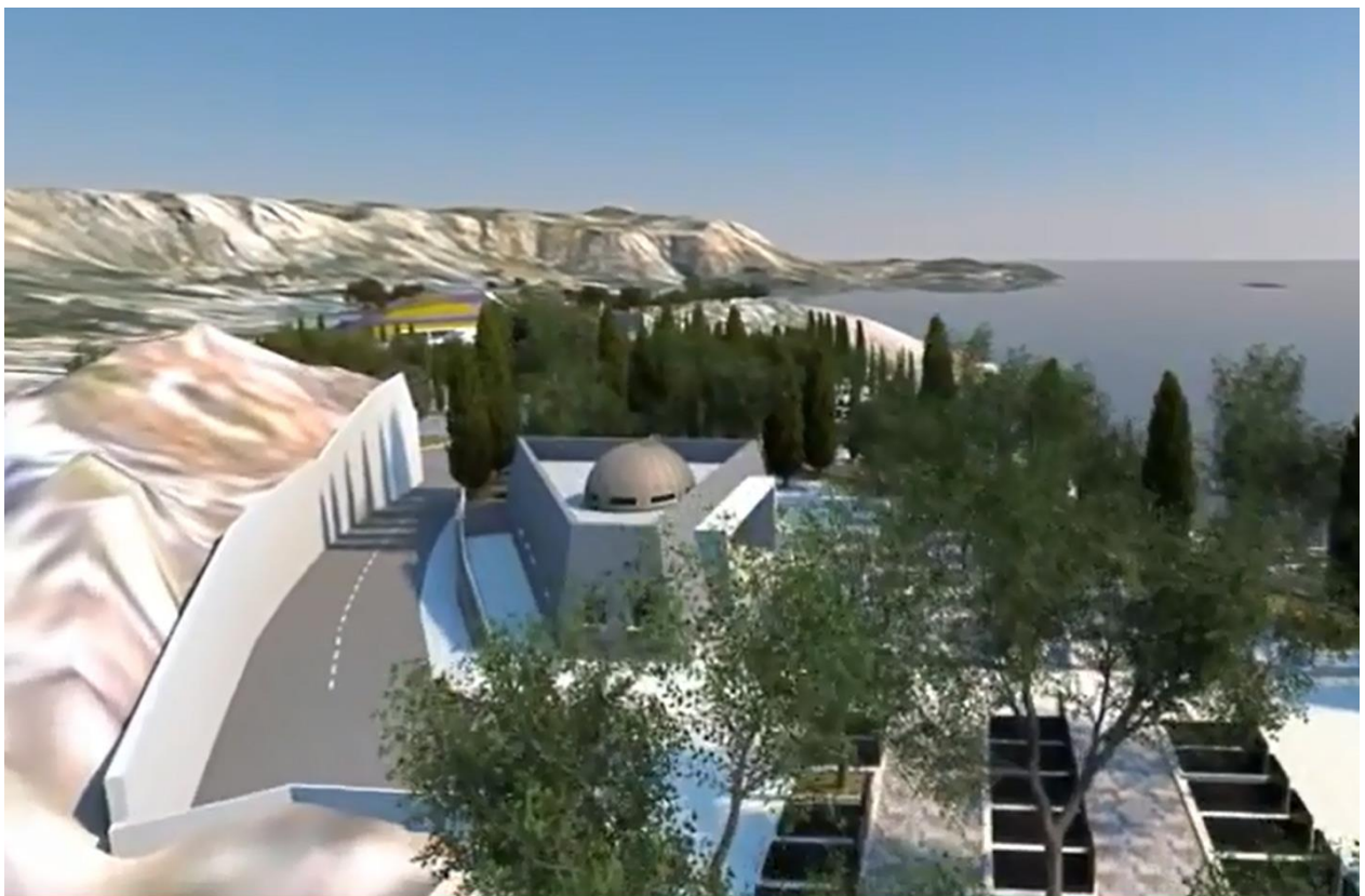
Prikaz 3: Vizualizacija Trames Consultants d.o.o. – ostali potporni zidovi unutar zapadnog dijela obuhvata