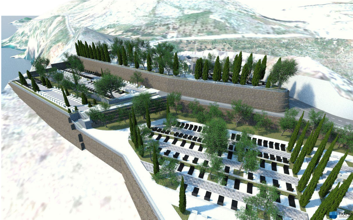
Prikaz 1: Vizualizacija Trames Consultants d.o.o. – južni potporni zid i ostali potporni zidovi

Zid se u duljine cca. 500 m sastoji od elemenata gabiona i terramesh sustava. Temeljenje zida izvodi se u stijeni, na potpornoj konstrukciji od AB sidrenih pilota te AB L-zida.