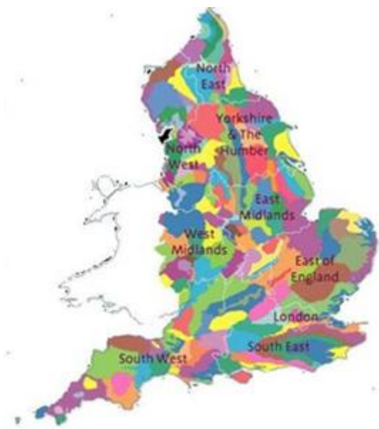
Karta tipova krajolika Engleske, 2003.