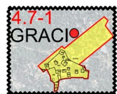
DETALJI UKLOPA GRAĐEVINSKOG PODRUČJA U DOF