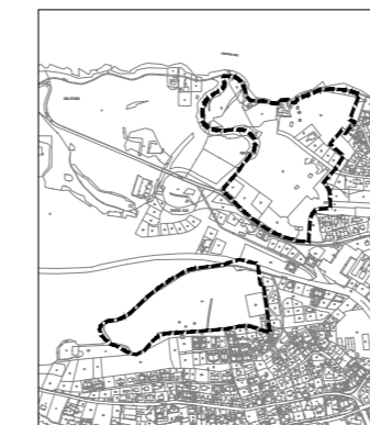
OBUHVAT IZMJENA I DOPUNA PROSTORNOG PLANA UREĐENJA GRADA DUBROVNIKA