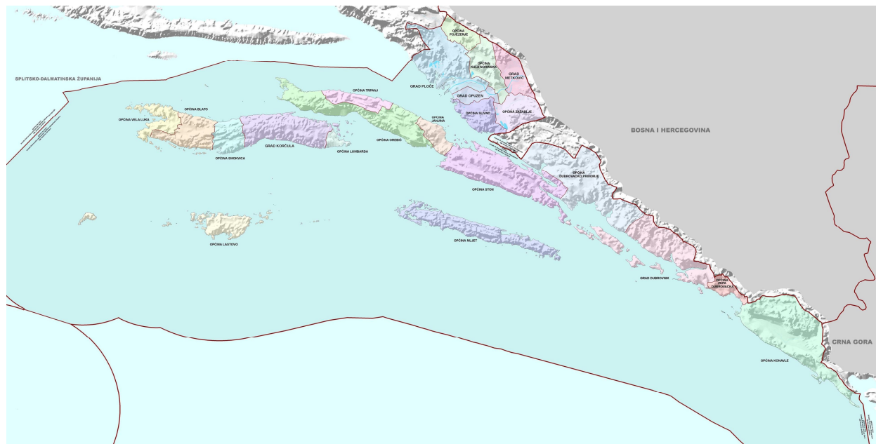
Slika 1. Položaj i granice Dubrovačko-neretvanske županije