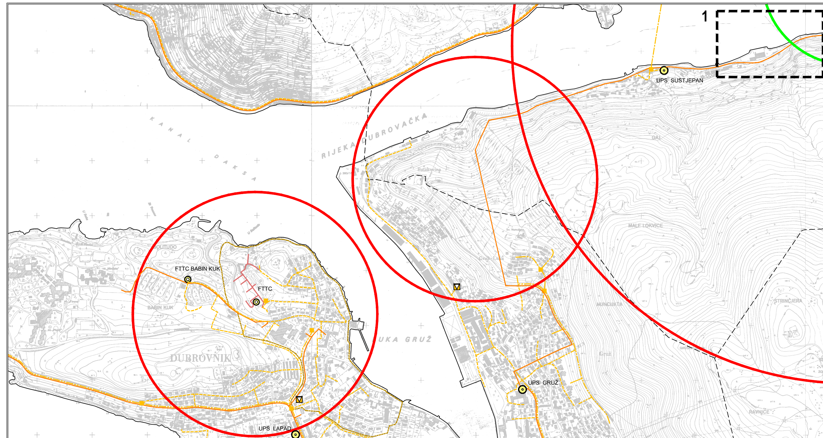
GENERALNI URBANISTIČKI PLAN (Službeni glasnik Grada Dubrovnika, broj 10/05, 10/07, 08/12, 3/14, 09/14 - pr. ispr., 4/16 - odluka o izmjeni, 20/18)