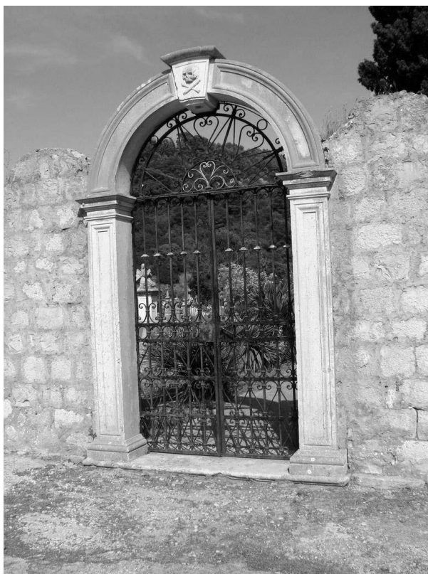
Glavni ulaz u groblje

Još sredinom 17. stoljeća, prema matici umrlih župnog ureda, umrli su se sahranjivali u crkvama u naselju i oko njih, a najviše oko crkve Sv. Marija u Polju i u samoj crkvi.