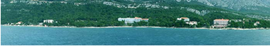
SLIKA 2: POGLED IZ PELJEŠKOG KANALA