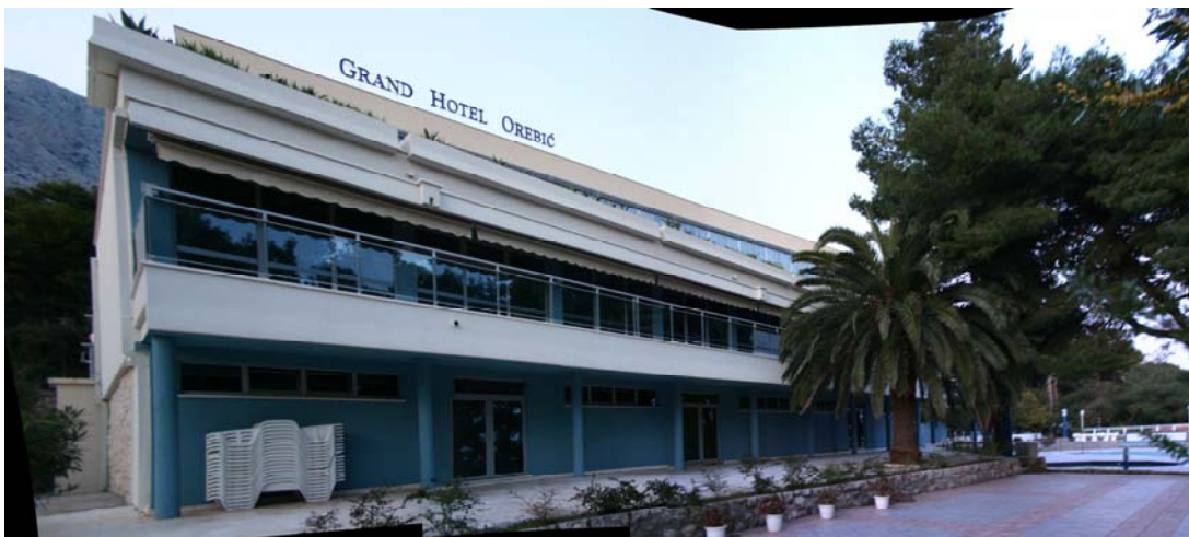
SLIKE 13, 14 I 15: OBUHVAT POJEDINAČNOG ZAHVATA T1-2