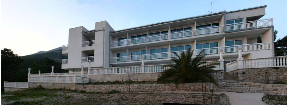
SLIKA 16: OBUHVAT POJEDINAČNOG ZAHVATA T1-3