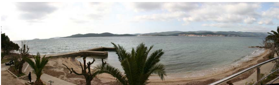
SLIKE 3, 4, 5, 6 7,8 | 9: OKOLIŠ U OBUHVATU PLANA