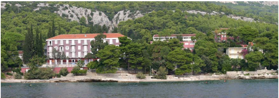
SLIKE 17 I 18: OBUHVAT POJEDINAČNOG ZAHVATA T1-4