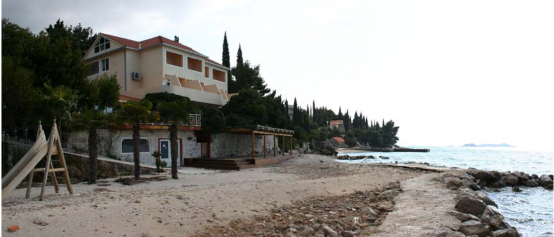
SLIKA 10: OBUHVAT POJEDINAČNOG ZAHVATA T1-5