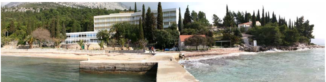
SLIKE 11 I 12: OBUHVAT POJEDINAČNOG ZAHVATA T1-1