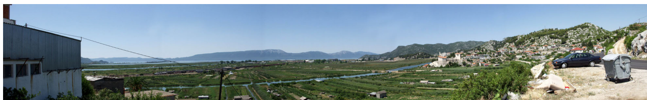
POGLED IZ MJESTA ČEVELJUSA PREMA STABLINI I PLOČAMA

Također, u svim fazama postupka zbrinjavanja otpada (prikupljanje, odlaganje) obavezno je vršiti selekciju i razdvajanje po vrstama (biorazgradivi otpad, opasni otpad, reciklažni otpad, otpad za termičko uništavanje i sl.).