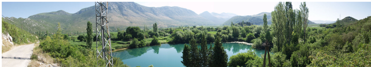
JEZERO MODRO OKO