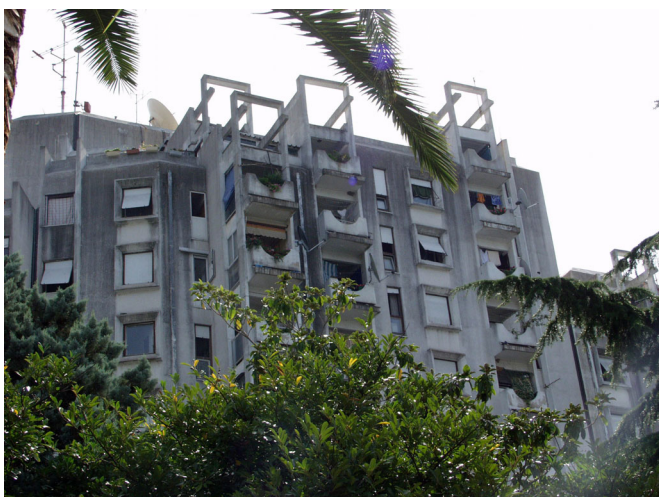
VIŠESTAMBENA IZGRADNJA U PLOČAMA