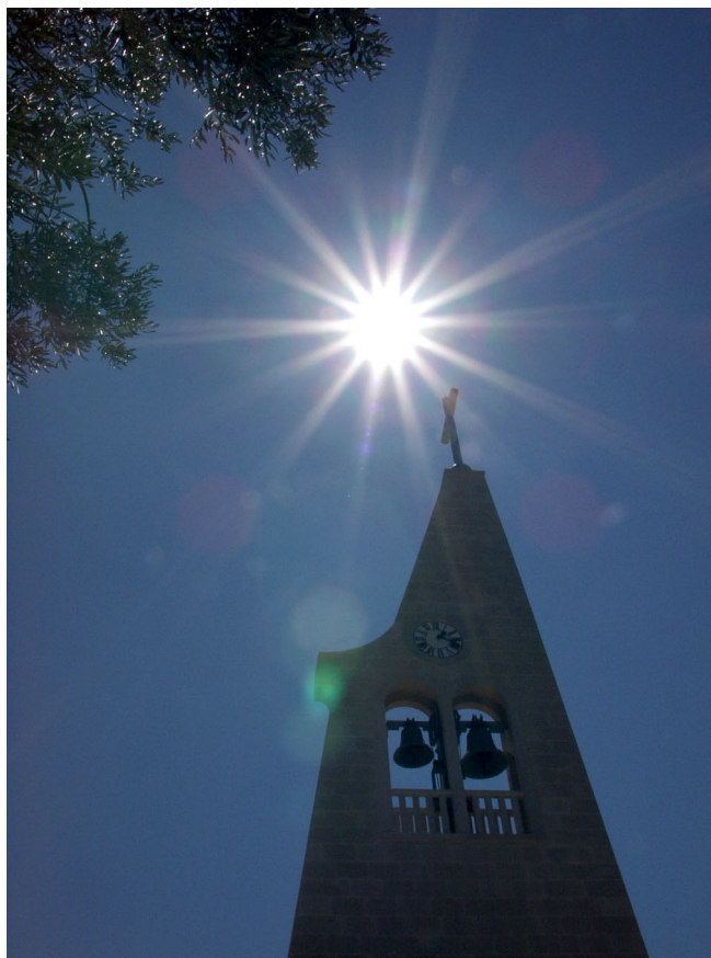
CRKVA U MJESTU STABLINA