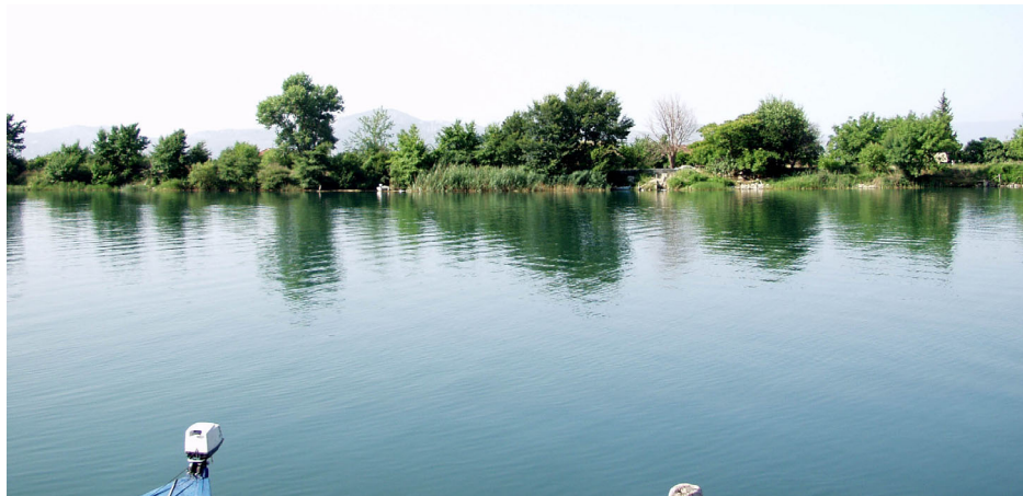
VELIKA NERETVA U KOMINU