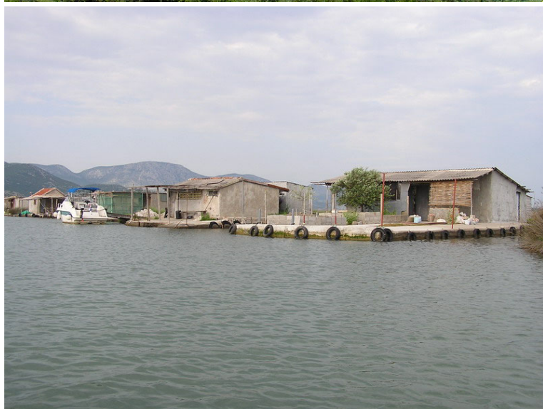
Divlja gradnja na području Parila

Za područja prirodnih vrijednosti potrebno je razraditi mjere očuvanja i upravljanja te formalno provesti postupak za proglašavanje Baćinskih jezera značajnim krajobrazom i dijela ušća ihtiološko-ornitološkim rezervatom. Za zaštićena područja nužno je osigurati nadležnu službu za upravljanje (županijska javna ustanova za zaštićena područja, javna ustanova za Park prirode Delta Neretve, eventualno može postojati i javna ustanova za zaštitu prirode Grada Ploče). Neophodno je jačanje i veća djelatnost inspeksijskih službi u cilju suzbijanja divlje gradnje te ilegalnog lova i ribolova.