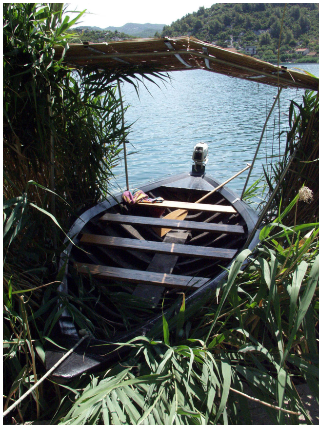
NERETVANSKA LAĐA UREĐENA ZA PRIJEVOZ TURISTA