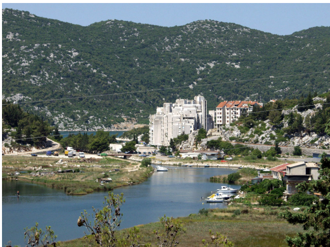
CRNA RIJEKA NA ULAZU U PLOČE

Ugroženost bukom je prisutna u i iz gospodarske zone luke Ploče, te posebno u smjeru prema stambenom dijelu rezonancom preko uvale, te uz željezničku trasu, gdje nema nikakve zaštite od buke.