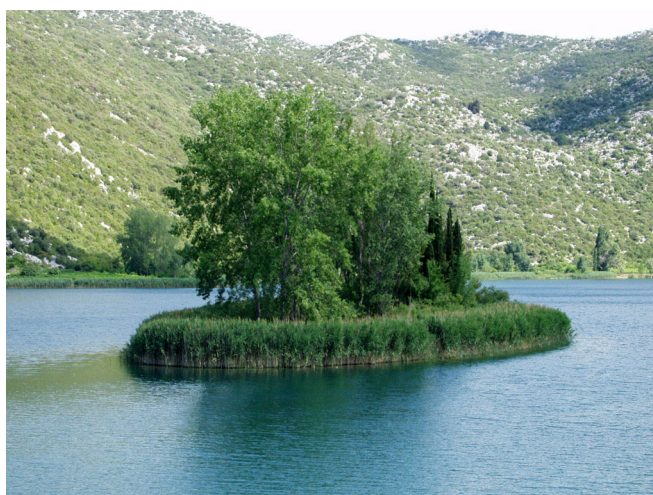
OTOK U JEZERU OČUŠA