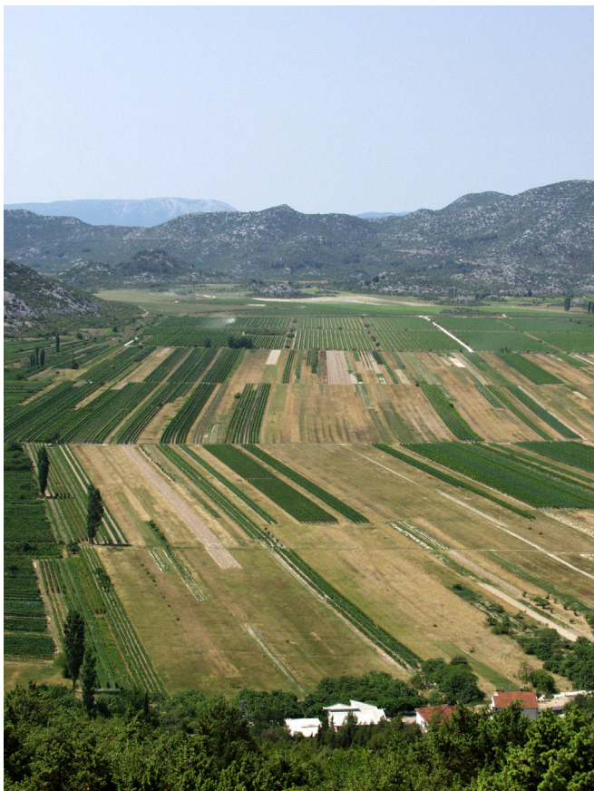
POGLED S POZLE GORE NA JEZERA