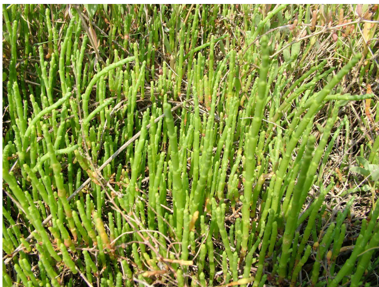
Caklenjača ( Salicornia fruticosa ) na ušću Neretve

Na području Grada Ploča, uključujući širi prostor delte Neretve, zabilježeno je 36 vrsta ugroženih na nacionalnoj razini ( Crveni popis ugroženih vrsta Hrvatske, DZZP, 2004. ) od kojih su dvije ugrožene na europskoj razini i zaštićene temeljem EU Direktive o staništima: raznorotka ( Marsilea quadrifolia ) i kranjska jezernica ( Eleocharis carniolica ). Veći dio ugroženih vrsta vezan je uz također ugrožena močvarna staništa i slanuše.