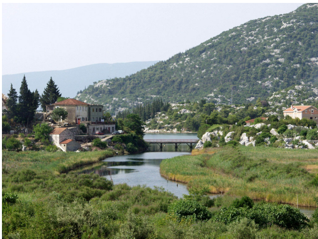
KANAL JEZERO SLADINAC - MORE