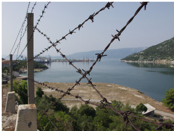
VOJNA LUKA U PLOČAMA