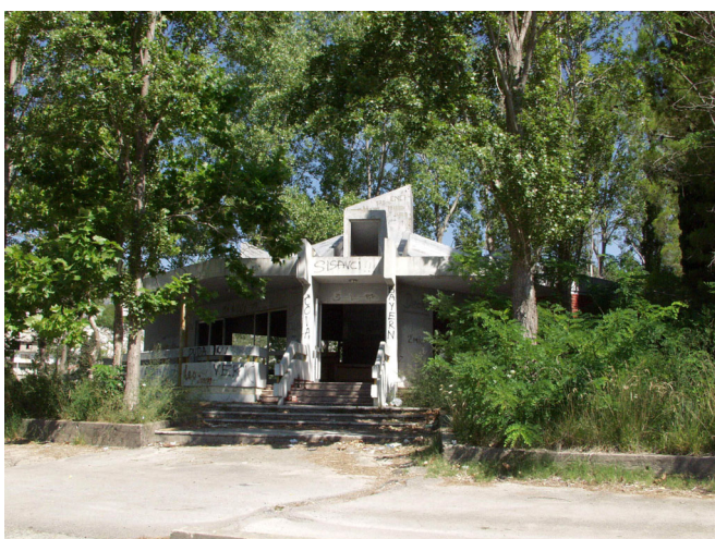
ZAPUŠTENI KAMP NA BAČINSKIM JEZERIMA