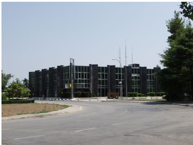
NOVA GRAĐEVINA POŠTE U PLOČAMA