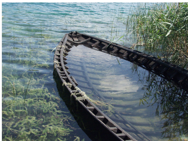
STARA NERETVANSKA LAĐA NA BACINSKIM JEZERIMA