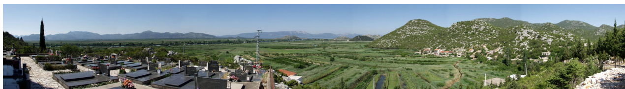
POGLED S GROBLJA MALI GAJ U MJESTU BANJA