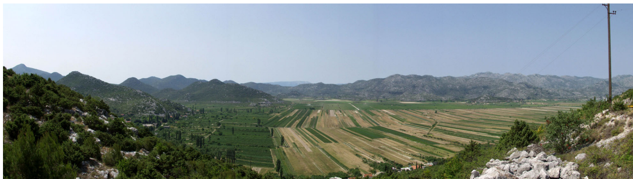
POGLED S POZLE GORE NA JEZERA